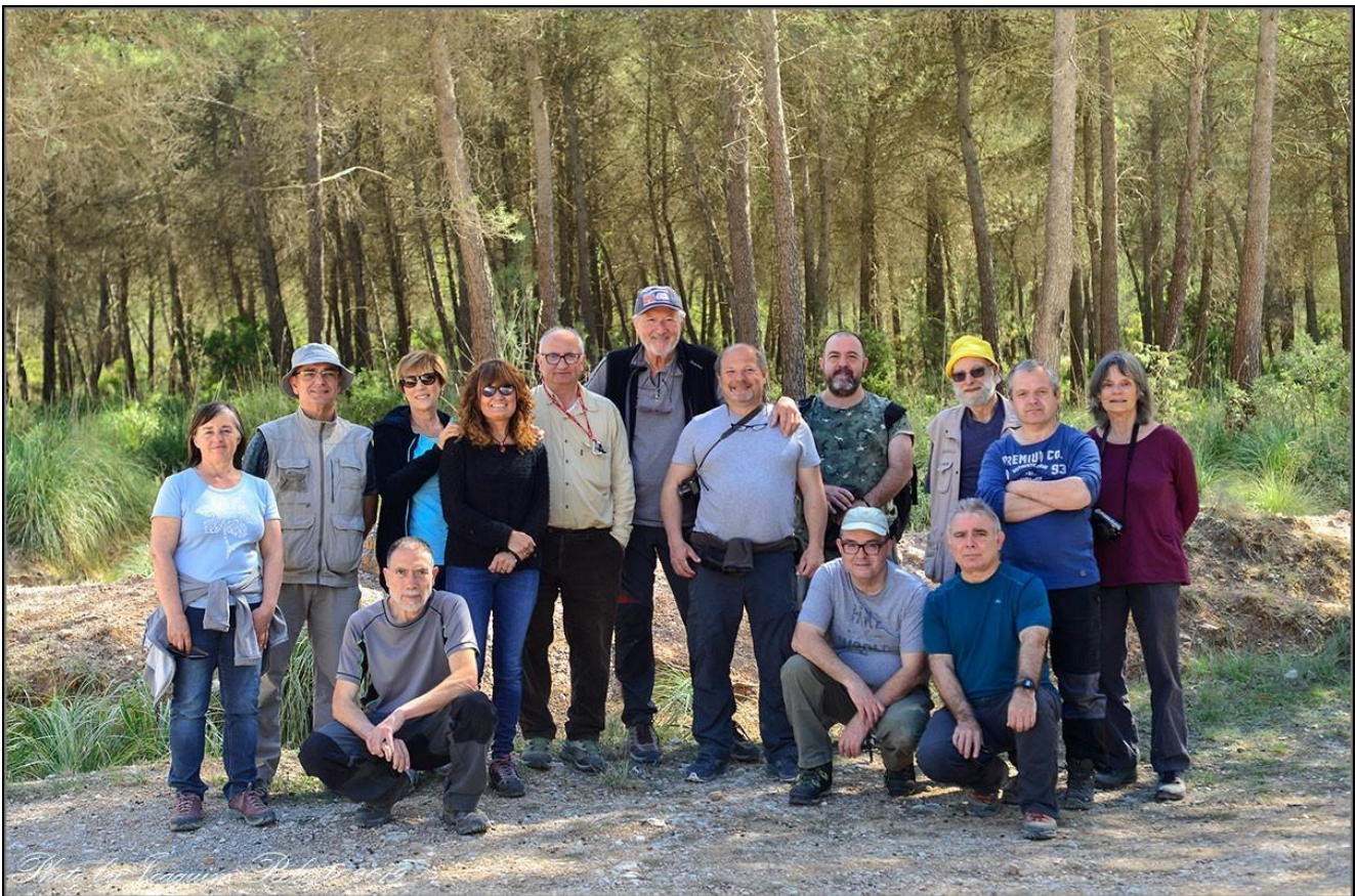
A dalt, imatges d' Ophrys passionis ; a baix, foto de grup dels assistents a la sortida.