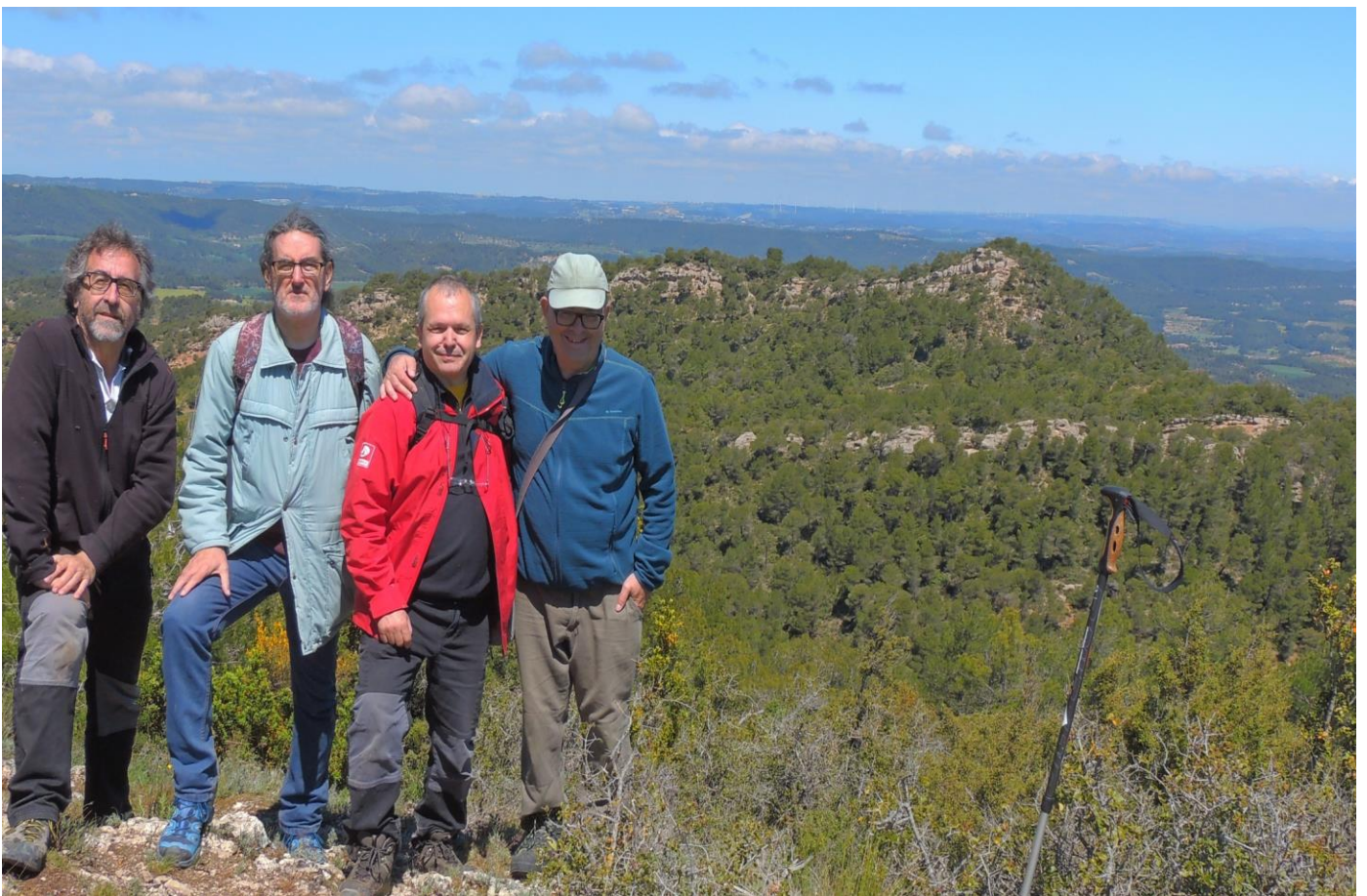
A les imatges, alguns dels membres del GOA i el GOC assistents a la sortida.