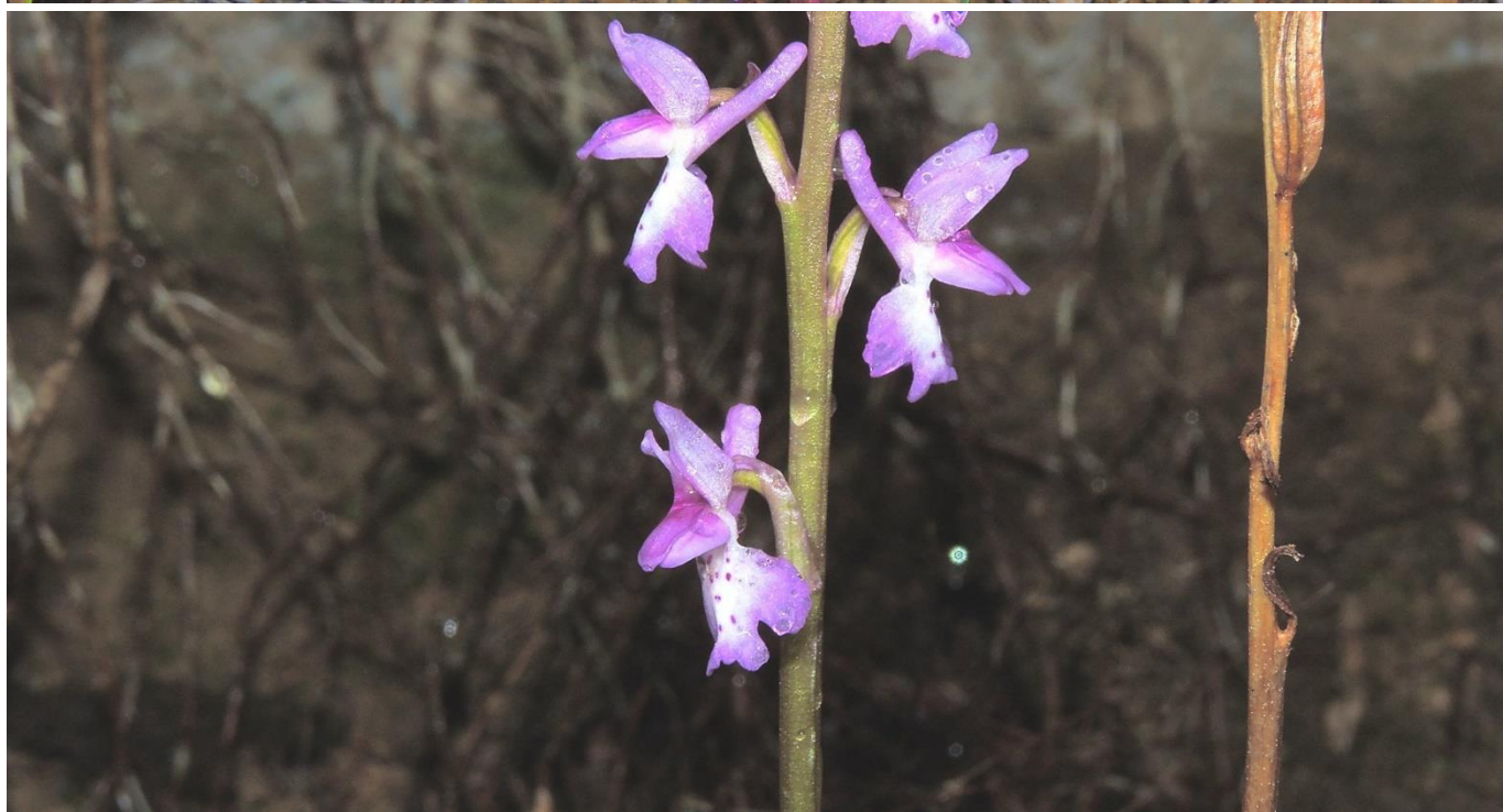
Exemplars d' Orchis tenera fotografiats a la sortida