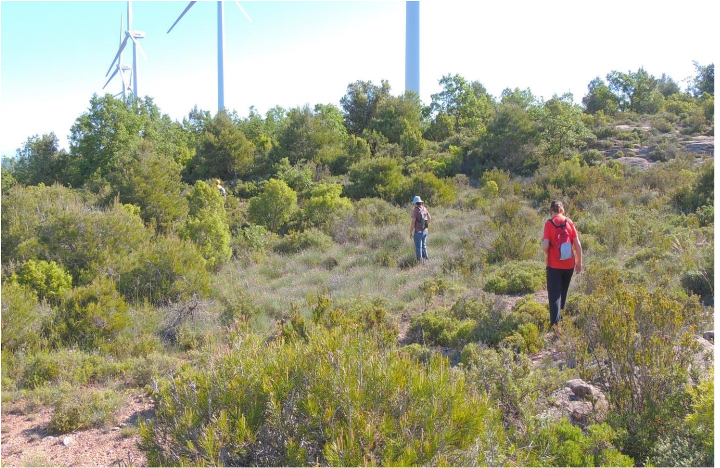
Alguns assistents a la sortida prospectant la zona del parc eòlic.