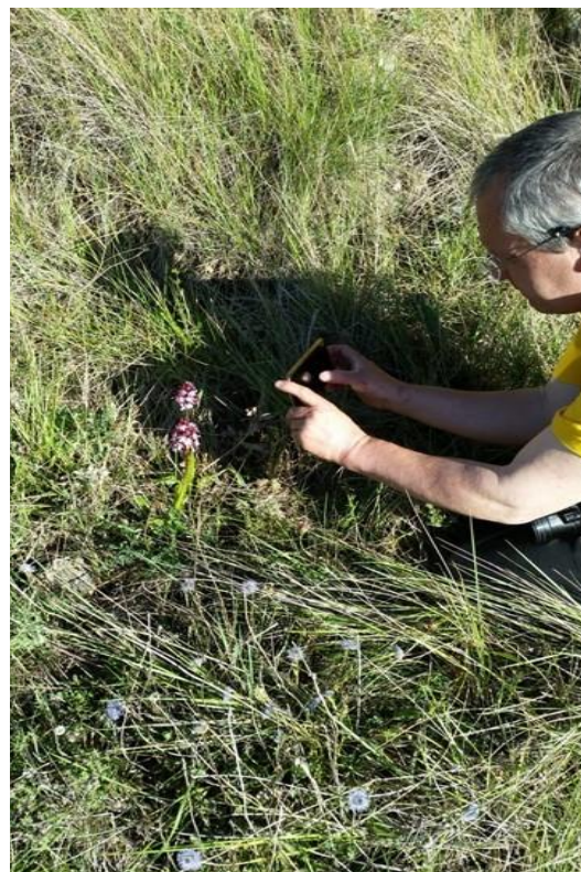
Un dels assistents fent una foto amb el mòbil.