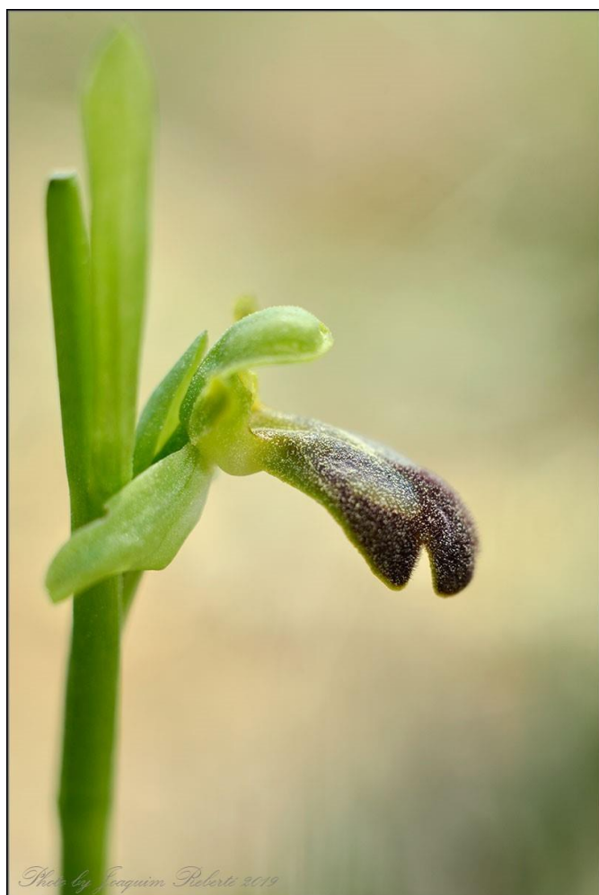
Fotografies d' Ophrys forestieri .