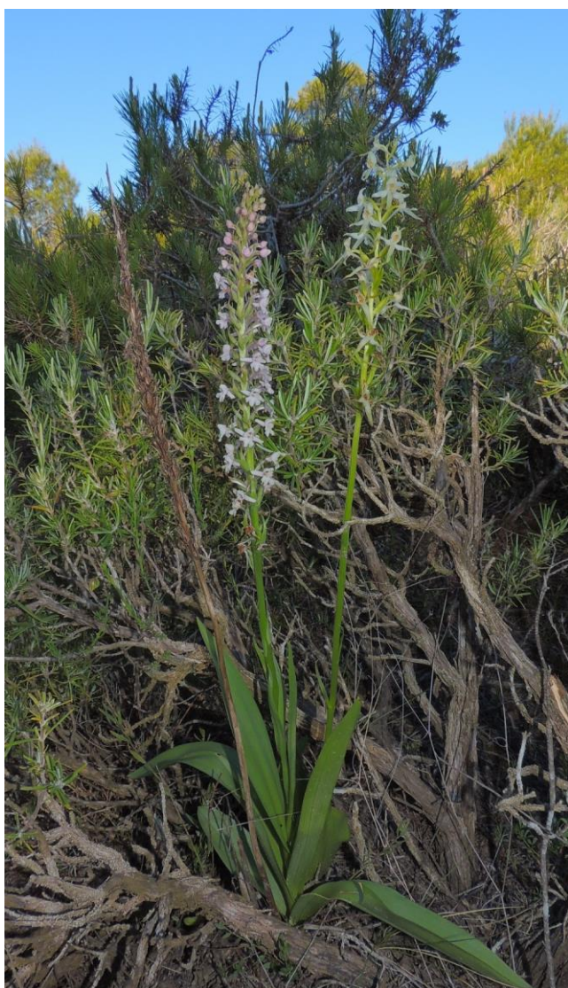
Exemplars de Gymnadenia conopsea trobats a la sortida.

Agraïm sobretot a Josep Escolà i Toni Aguilera per la seva ajuda per buscar els llocs a prospectar i també a tots els assistents a la sortida. Text. Jordi Vila