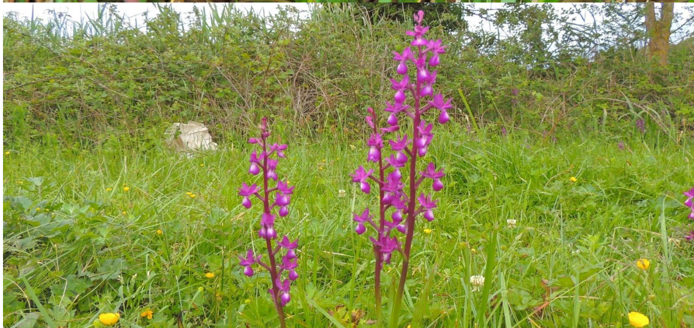
Imatges de Serapias lingua i d' Anacamptis laxiflora trobades a la sortida.