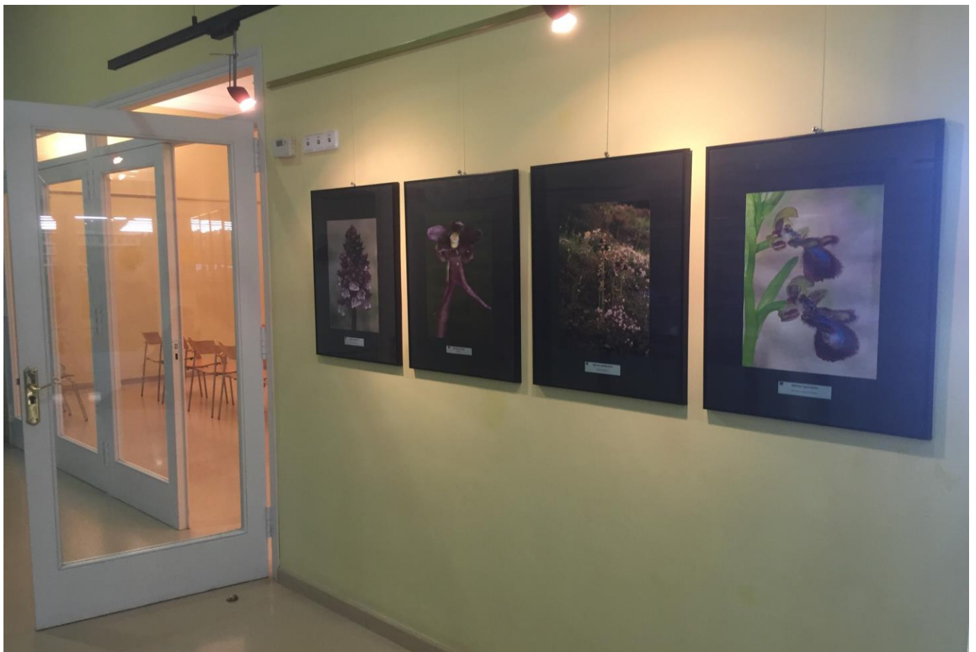
Dues imatges de l'exposició fotogràfica ja muntada a Cal Sitges (Artés)